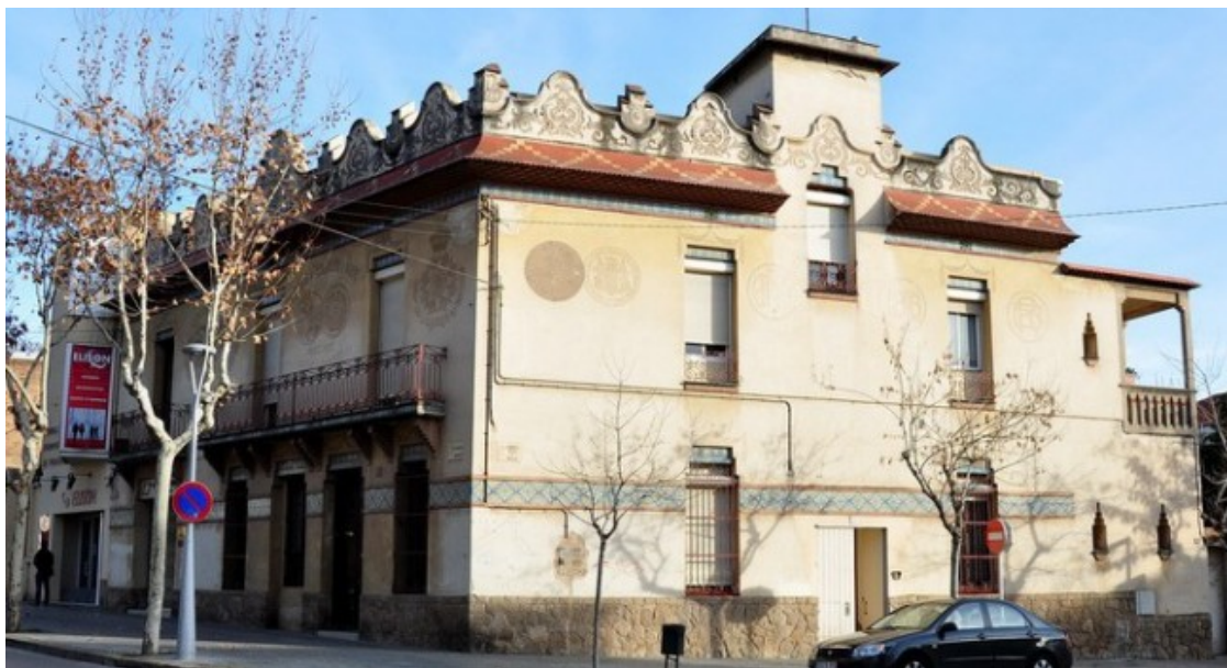
Casa Cauhé Raspall (Sant Feliu de Llobregat)

Encara hi ha, sortint de casa al pati, la repintada porta dels grans vidres, i avui que es mou un vent de primavera l'he deixada entreoberta.