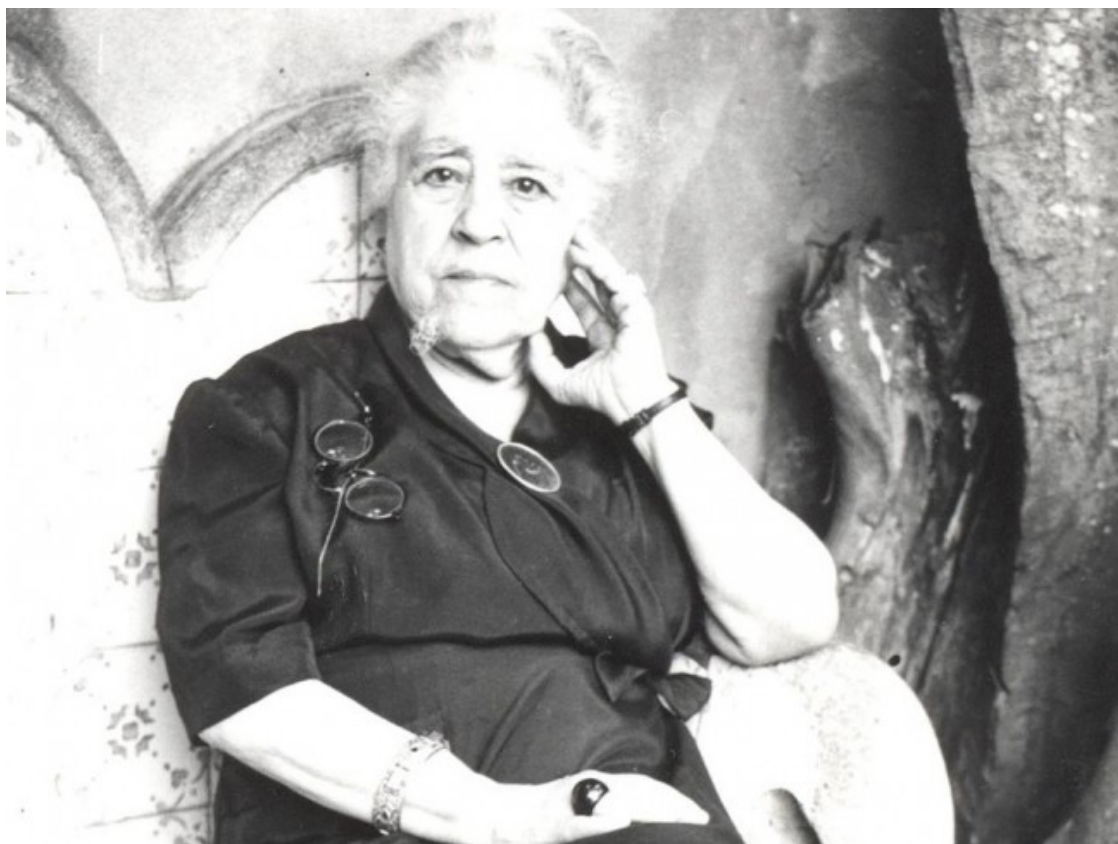
Caterina Albert al pati de la casa pairal.

seva memòria i que acaba davant de la seva tomba en el Cementiri Mariner.