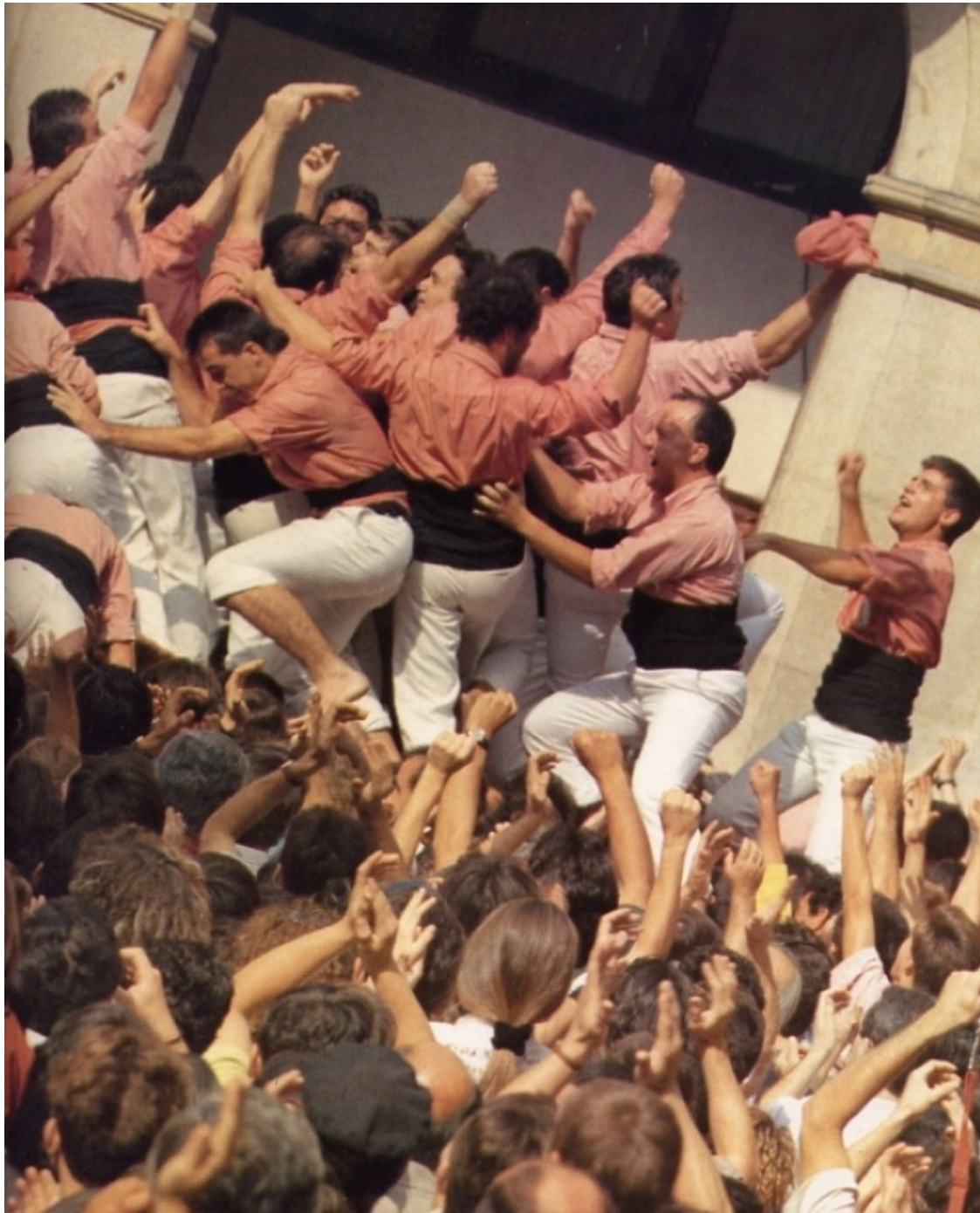
Castellers. Fotografia de Francesc Català-Roca, l'insigne fotògraf vallenc, que tanca el seu llibre «Valls, capital de l'Alt Camp». Valls: Ajuntament de Valls, Ed. Destino i IEV. 1991 .

-I què me'n diu, general, del poc que ha vist? Li agrada, aquesta terra? -interposà don Ramon.