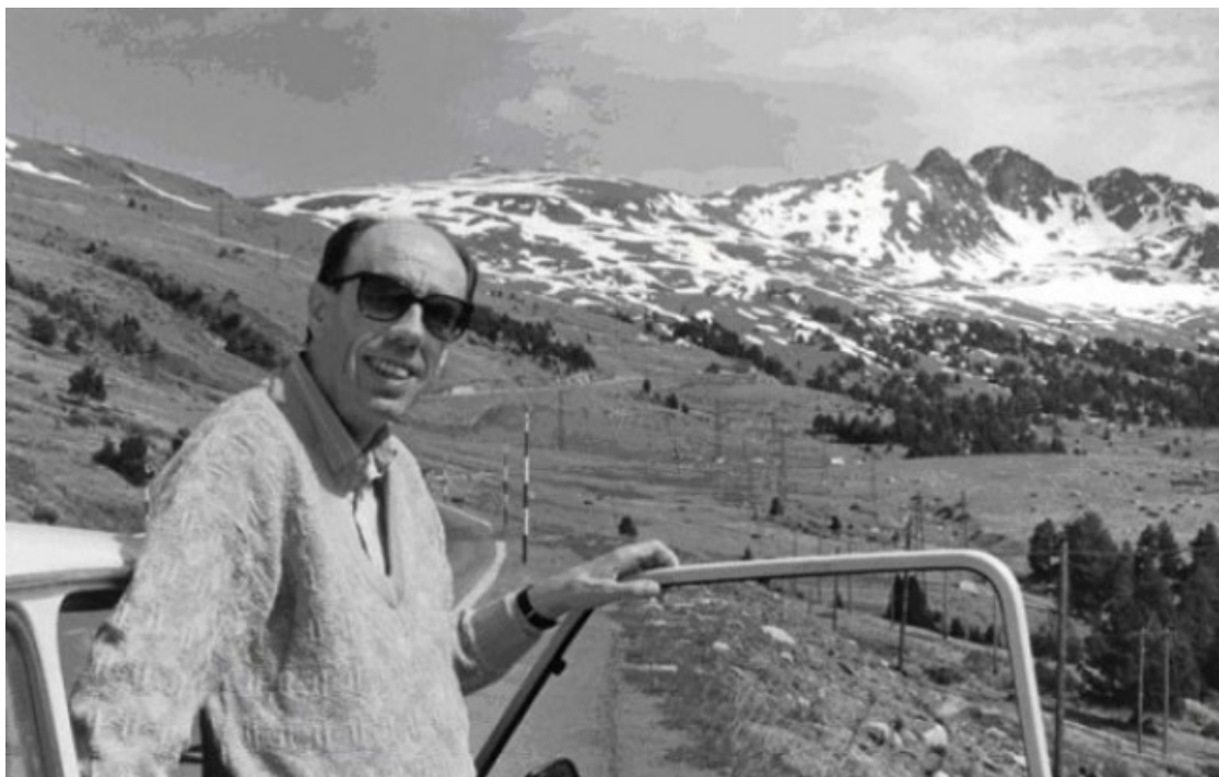
Andorra, 1988.

El poema relata vivències -anècdotes, records, etc.- de les estades que va fer Miquel Martí i Pol (1929- 2003) a les valls andorranes amb la seva família, principalment durant els anys seixanta. Al mapaliterari.cat ( http://www.mapaliterari.cat/ca/espai/canco-andorra/miquel-marti-i-pol ) hi ha més poemes d'aquesta època recitats pel seu germà Ramon ( Andorra, postals i altres poemes , 1984), i d'altres, dedicats als Llacs de Tristaina o la Vall d'Incles ( Nou poemes d'Andorra (1986 i 1992). Dins Obra poètica IV: 1990-2003 ).