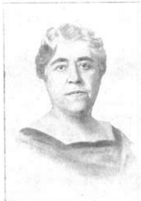
Victor Català, en la foto que il·lustrava la conversa amb Tomàs Garcés, l'any 1926.

Per això no prodigà tampoc les declaracions personals, i encara les féu tan «impersonals» com pogué, sobretot a mesura que passaren els anys i les generacions, i amb ells la vigència de la seva obra literària, entre el naturalisme i el modernisme. D'altra banda, i aquest potser és el fet decisiu, hi hagué entremig d'anys i generacions, la consciència del fracàs de Victor Català com a novel·lista: Solitud tingué amb l'aparició de la novel·