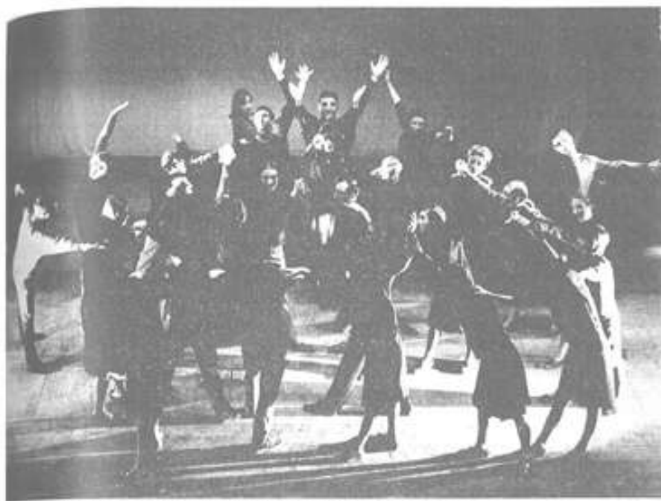
Un moment característic de La Passió d'Horta .

Vietnam. I la seva Resurrecció torna a realitzar-se en les rialles dels infants, en la feina feta alegrement, sense vexacions ni amenaces, en la collita que la terra dona arreu any rera any. La Redempció adquireix així un sentit transcendent que s'evidencia tant al cristià com al no cristià; un sentit que més enllà del clam i del dolor deixa oberta una escletxa a l'esperança, a la comesa de l'home en aquest món, aquí i ara.