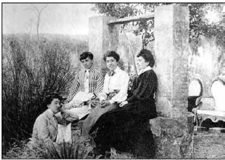
CASA-MUSEU EL CLOS DEL PASTOR / INSTITUT CATALÀ DE LA DONA

ENTRE DUES AMIGUES, A LA CISTERNA DE LA CASA PAIRAL