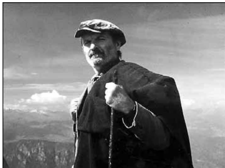
OMERO ANTONUTTI EN LA VERSIÓ CINEMATogrÀFICA DE 'SOLITUD'