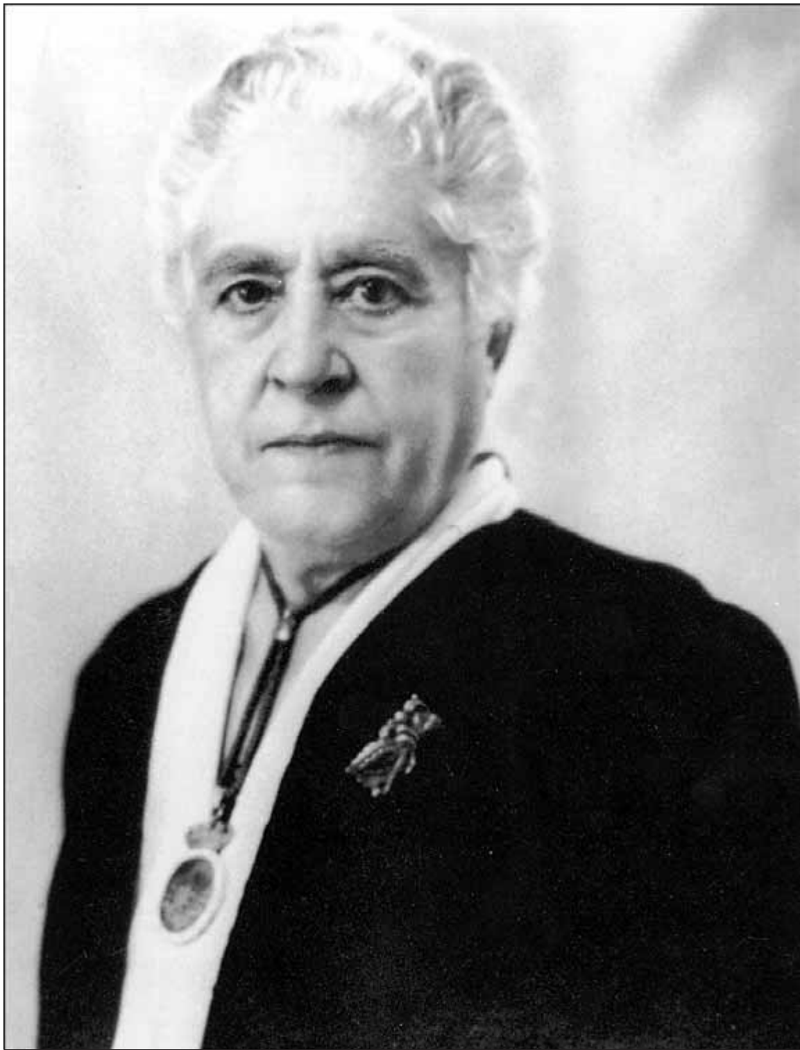
CATERINA ÀLBERT VA SER LA PRIMERA DONA (1923) QUE VA INGRESSAR A LA REIAL ACADEMIA DE LES BONES LLETRES