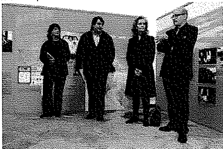
La inauguració de l'exposició va tenir lloc divendres

L'exposició d'homenatge a Maria Àngels Anglada ja és a la Llotja del Blat de Vic. Divendres se'n va fer la inauguració. Entre els materials que s'hi exposen hi ha els poemes de joventut i infantesa escrits a Vic en la seva etapa escolar.