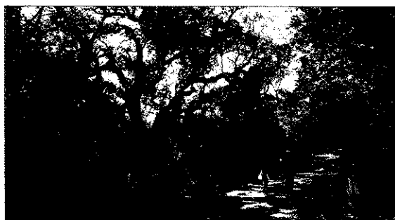
L'empremta ▶ A dalt, vista del mirador pròxim a la casa de Rodoreda. Al centre, a l'esquerra, taula del restaurant que freqüentava. A sota, un camí de la ruta. Sobre aquestes línies, dolmen de la Cova d'en Daina.

claus al restaurant. Hi trobarà peces antigues de valor notable, algunes procedents de Sant Cebrià dels Alps.