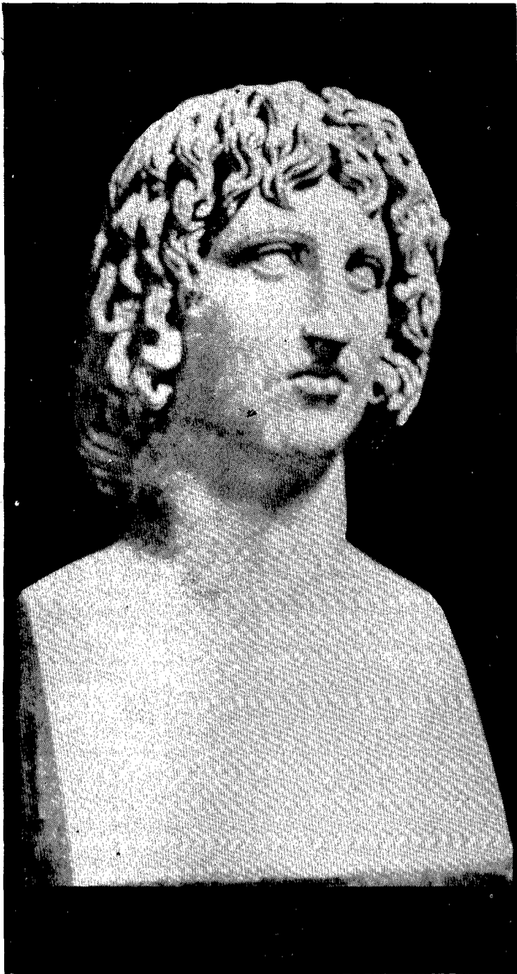
Bust de Virgili, que es conserva al Museu Capitolí de Roma.

A quest any de 1981 el món clàssic es disposa a commemorar un esdeveniment molt important per a la literatura universal: el bimil·lenari de la mort del poeta Virgili. L'autor de l'Eneida va morir el 22 de setembre de l'any 19 abans de Crist a la localitat calabresa de Brindis, al Sud d'Itàlia, en retornar del seu viatge a Grècia. Fou enterrat, d'acord amb la seva voluntat, en el camí de Putèoli, a dues milles de Nàpols. Ell mateix s'havia compost l'epitafi, segons la tradició, modest i quasi insignificant, però que resumeix la seva vida i la seva obra: