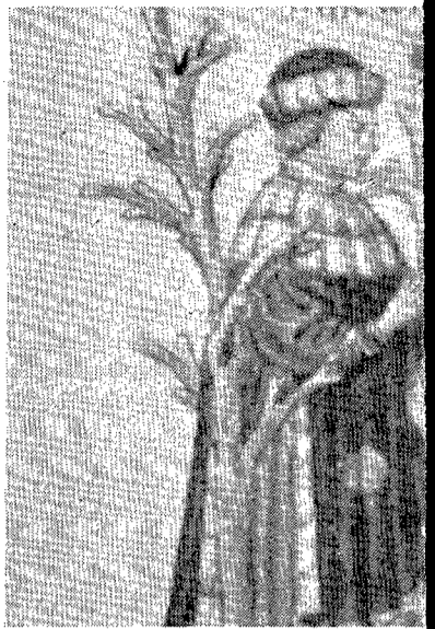
Dante i Virgili "al bosc vivent"; miniatzenziana, Florència)