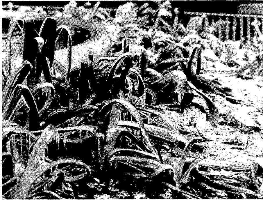
Imatge d'un hivern orc i gèlid.

A ra, quan la natura tota comença a vestir-se amb els seus colors més vius i brillants, i és a punt d'estrenar la nova estació, la primavera gentil i radiant, després de la tristor, nuesa i ermor d'un hivern orc i gèlid.