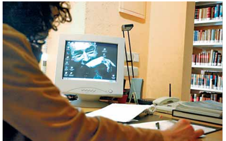
La Fundació Pla conserva la biblioteca de l'escriptor, manuscrits i correspondència ■ M. LLADÓ