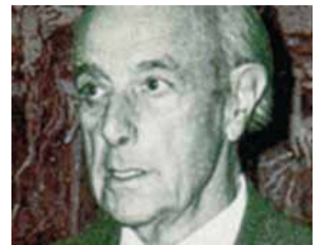
D'esquerra a dreta i de dalt a baix: J.V. Foix, Salvador Dalí, Manuel Brunet, Josep Pla, Eugeni d'Ors i Llorenç Villalonga, sembla ser que formen part de la cara fosca de la cultura catalana

E s tracta d'una selecció de 14 de les ponències que es van presentar en un congrés organitzat pel Centre of Catalan Studies de Queen Mary