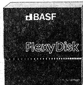
BASF FlexyDisk 5.25", 5.25" HD, 8"

Absoluta seguridad de datos y funcionamiento con una duración muy superior: un promedio de 35 Mill. de pasadas por pista.