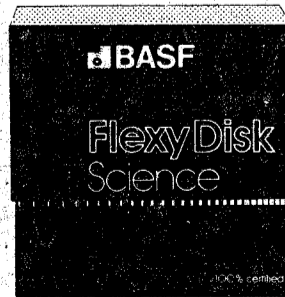
BASF FlexyDisk Science 5.25", 5.25" HD

Absoluta seguridad de datos y funcionamiento con una duración muy superior: un promedio de 35 Mill. de pasadas por pista.