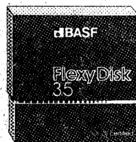
BASF FlexyDisk 3.5"

La máxima calidad para condiciones de aplicación difíciles. Estable a la temperatura hasta + 70° C. Comprobación de la superficie al cien por cien. Duración de uso: un promedio de 70 Mill. de pasadas por pista.