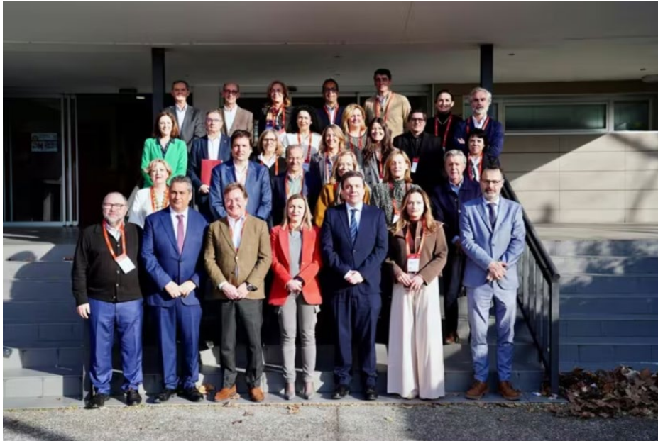
Reunion-Consejo-Sociales-Unirioja-Secretarios Consejos Sociales

https://www.europapress.es/la-rioja/noticia-ur-acoge-reunion-comision-secretarios-ccc-colaboracion-universidad-sociedad-20260303102849.html#google_vignette