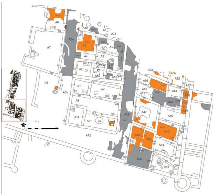
Figura 1. Planta del sector sud-est de la vila medieval.