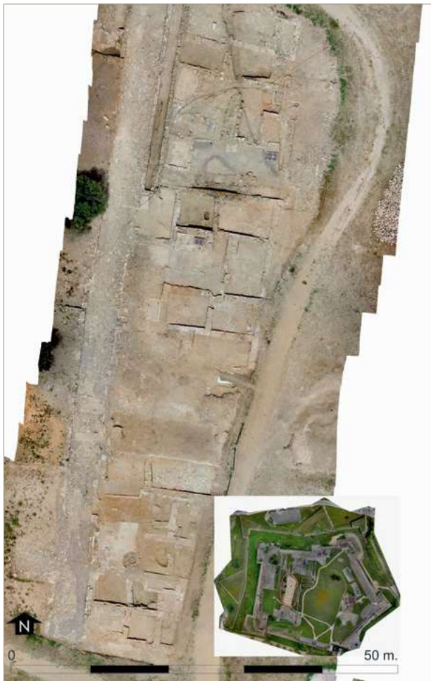
Figura 1. Ortofoto del sector excavat al nord-est de la vila medieval.

continuar aprofundint estratigràficament intentant reconstruir l'evolució de l'espai des del moment de creació de la vila medieval fins el seu abandonament. Aquesta segona fase dels treballs encara no ha finalitzat i en properes campanyes se seguirà aprofundint en nous espais.