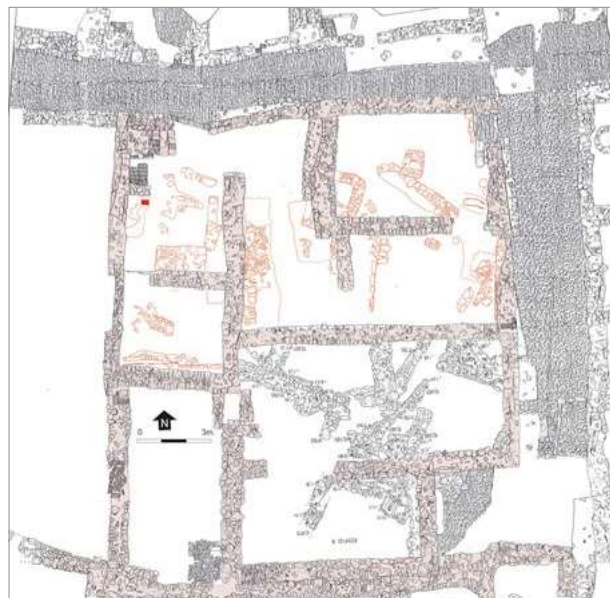
Figura 1. Planta de la zona excavada en relació les estructures excavades els anys 1993-1996. En vermell les estructures localitzades l'any 2020.

Dins l'àmbit I també es van recuperar traces de dos murs (M12673 i M12738) que dibuixen una altra estança que es disposaria en paral·lel a la primera, separades