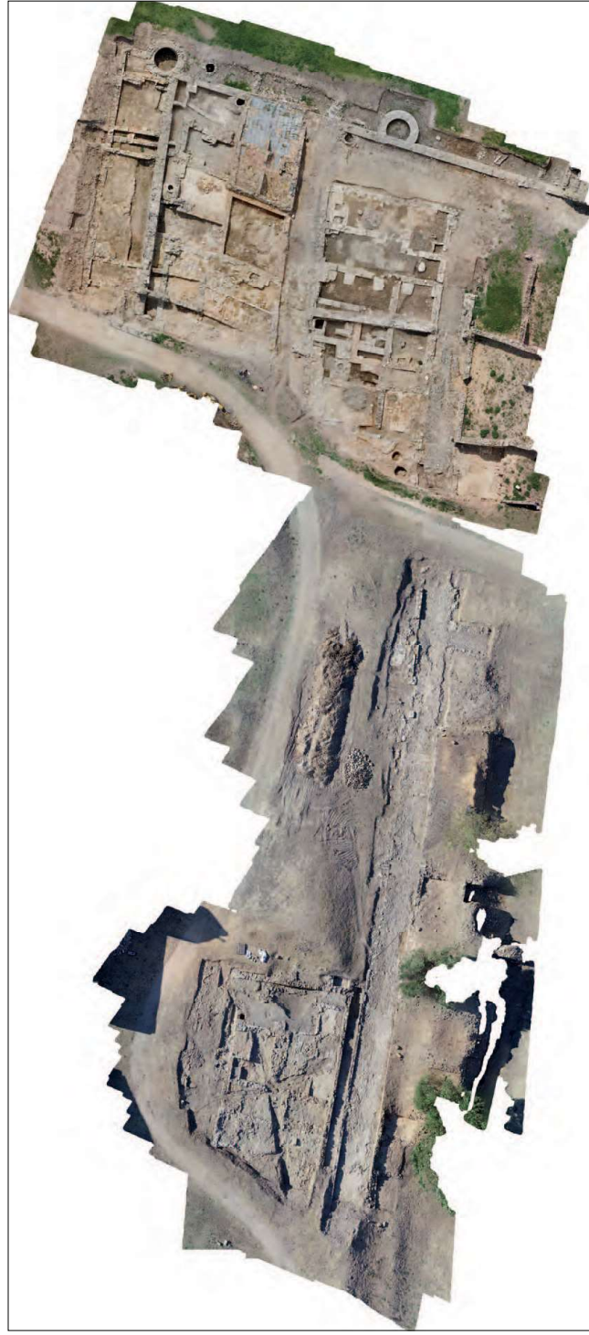
Fig. 1: Vista general del sector excavat a l'entorn del carrer Major de la vila medieval.

però, fins i tot en aquells moments, els treballs a la vila varen ser intermitents. Després d'un fort impuls inicial (1993-1996), els treballs es varen traslladar a d'altres sectors i no es varen reprendre fins al període 2008-2011 (Puig, 2016).