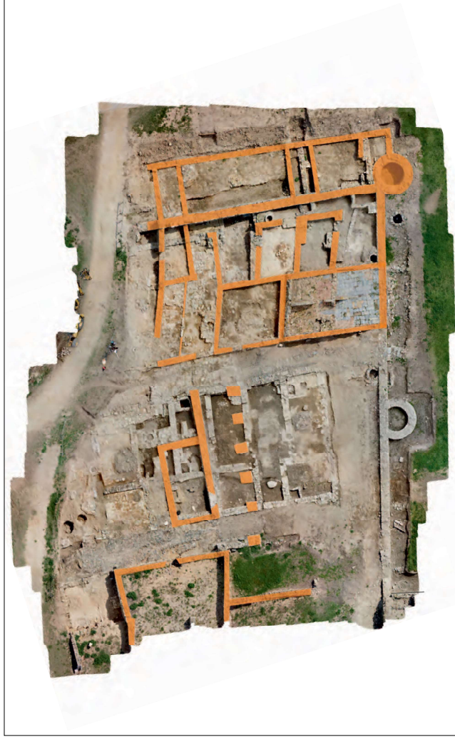
Fig. 3. Estructures existents a la zona sud del carrer Major i el carrer Nou a finals del s.XVII.

L'estructuració identificada fins al moment pertany essencialment a la configuració final de mitjans del segle XVII, moment d'abandonament de la vila en el marc de la Guerra dels Segadors i de la posterior ocupació de la plaça per les tropes franceses.