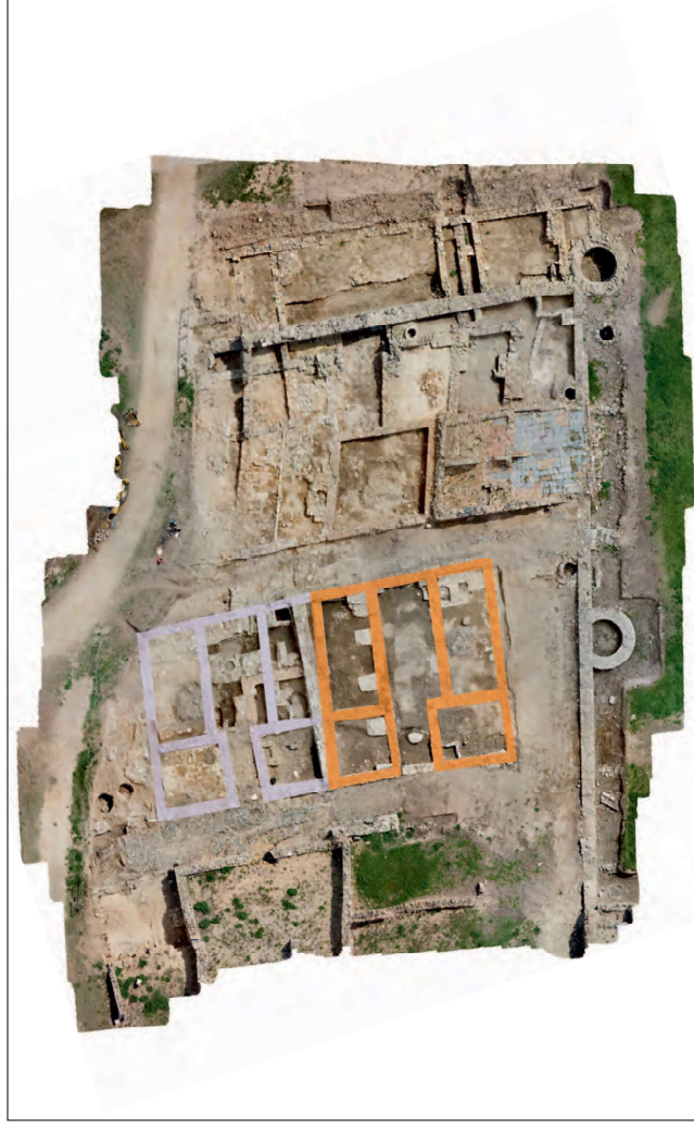
Fig. 2: Les dues grans cases identificades a l'extrem sud del carrer Major.

finançat per la Generalitat de Catalunya "La vila medieval de Roses i la configuració de l'urbanisme medieval al nord-est peninsular", varen rebre un fort impuls l'any 2020 amb la realització de dues grans campanyes arqueològiques que han permès recuperar una superfície de més de mil tres-cents metres quadrats del barri situat a llevant de la vila.