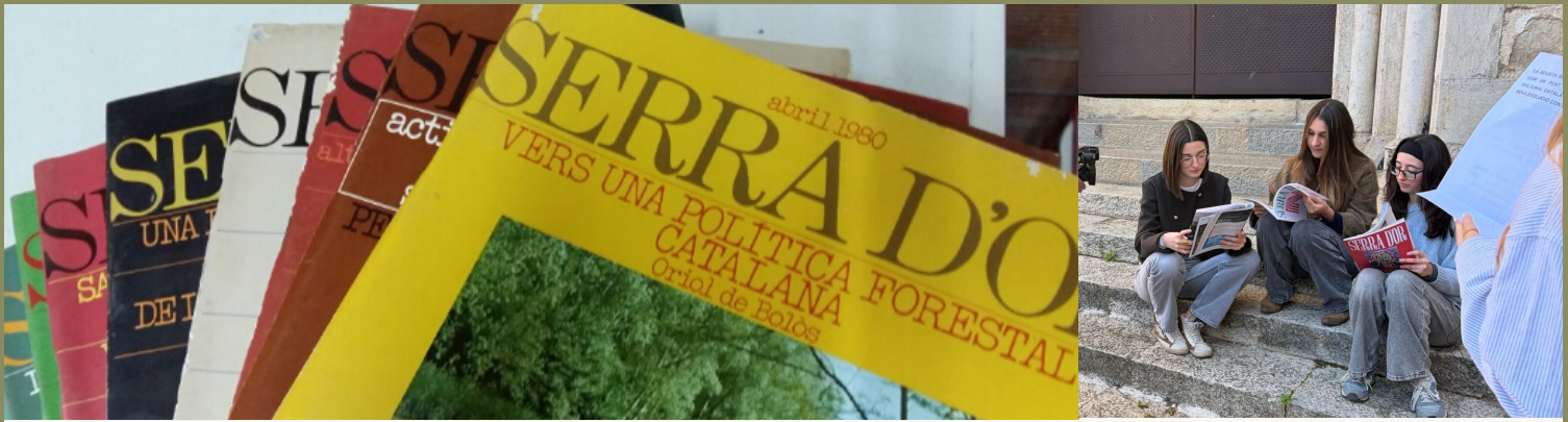
alumnes llegint Serra d'Or (propri)