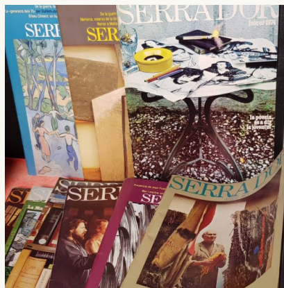
Col·lecció de revistes Serra d'Or

Reivindicar el slow journalism que tant enyorem funciona com un exercici necessari d'higiene democràtica. En un món on la infoxicació ens impedeix comprendre la realitat, fan falta publicacions que ens ofereixin una síntesi que ens ajudi a entendre el per què ha passat el que ha passat. El flux constant d'actualitat exigeix pausa per poder-ne extreure sentit.