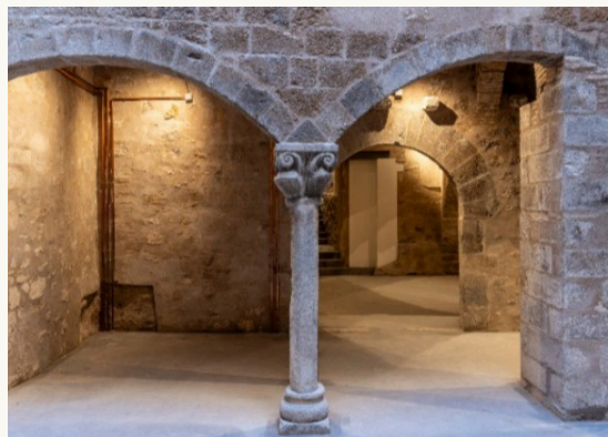
Casa Solterra (Lloc on es van realitzar les conferències)