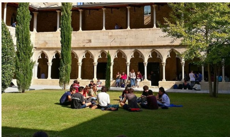
Facultat de Lletres i Turisme de la UdG (Universitat de Girona)

En perspectiva, iniciatives com aquesta construeixen ponts entre la universitat, i el teixit comunicatiu del país, i preparen els futurs del sector amb una mirada crítica però compromesa amb l'entorn.