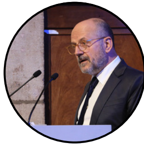
Figura 2. Font: Comunicació21 ramon-besa-el-periodisme-està-perdent

Avui en dia, el periodisme s'ha desplaçat cap a l'entreteniment més que cap a la informació. La gent vol riure i passar-s'ho bé, no tant informar-se. Tanmateix, no sempre cal jugar-se la vida per fer bon periodisme. Destapar una història oculta pot suposar un risc professional. Un periodista que investiga un poder fàctic de Girona pot enfrontar-se a pressions o fins i tot perdre la feina. A vegades, els mitjans convencionals es neguen a publicar informació comprometedora per no perjudicar certs interessos. Les xarxes socials no substitueixen el periodisme tradicional, però poden complementar-lo. Quan una empresa propietària d'un mitjà bloqueja una notícia per protegir els seus interessos, les xarxes poden convertir-se en una eina per garantir que la informació arribi al públic.