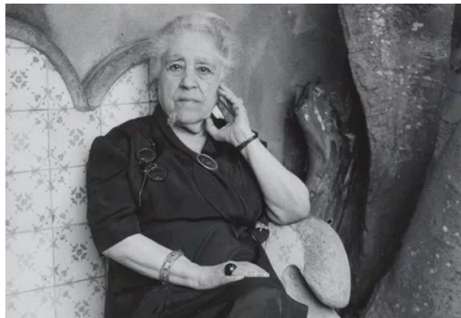
L'escriptora Victor Català.