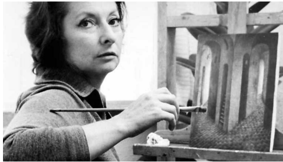
L'artista surrealista Remedios Varo.