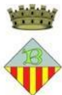
Ajuntament de Banyoles