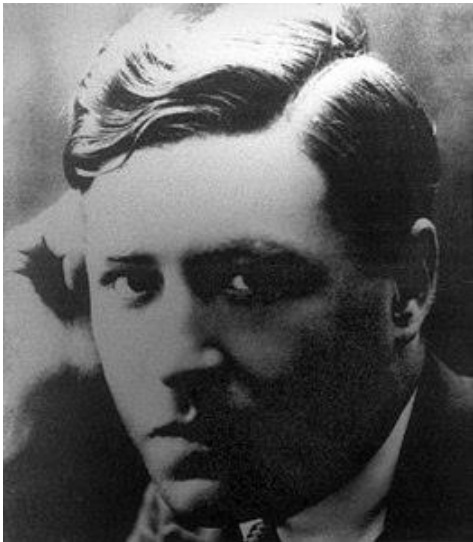
Autor desconegut, "Josep Pla", 1917 (Fundació Josep Pla)

1. Fixeu-vos en aquestes fotografies de Josep Pla. En grups, intenteu descriure amb característiques el més objectives possible el jove que veieu a cadascuna de les dues fotografies: