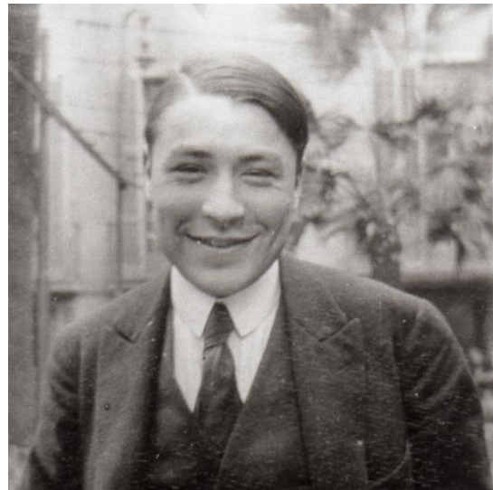
Autor desconegut, "Josep Pla a l'Ateneu Barcelonès", c. 1920 (Fundació Josep Pla)

2. Realitzada l'activitat anterior, intenteu destriar aquelles característiques comunes entre les dues fotografies.