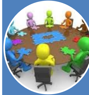
Aprenentatge Basat en Problemes (ABP)