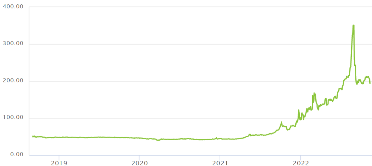
Figura 1. Evolució del preu de l'electricitat (€/MWh) a l'Estat espanyol, 2018-2022

La crisi climàtica és un altre factor que, amb l'increment dels fenòmens meteorològics extrems i amb uns registres de temperatures sense precedents, accentua la fragilitat del sistema elèctric que, amb el conflicte bèl·lic de Rússia, la major proveïdora de gas i petroli de la Unió Europea, ha situat el focus de la crisi no únicament en els preus dels combustibles, sinó en el subministrament mateix. Tot indica que els preus de l'energia aniran escalant i seran cada cop més volàtils en els propers anys.