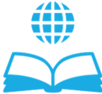
Educación y Juventud