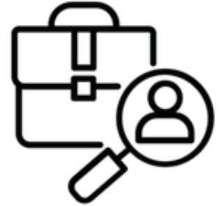
Habilidades y empleabilidad